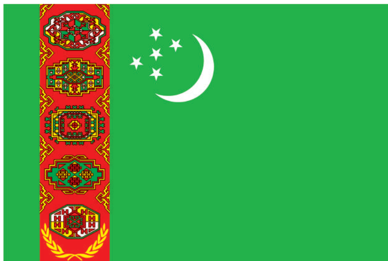
TÜRKMENISTANYŇ DÖWLET BAÝDAGY