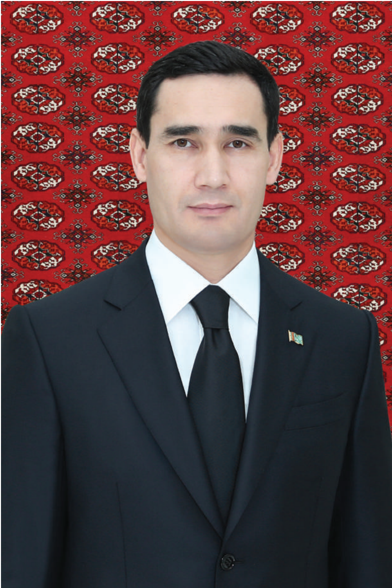
TÜRKMENISTANYŇ PREZIDENTI SERDAR BERDIMUHAMEDOW